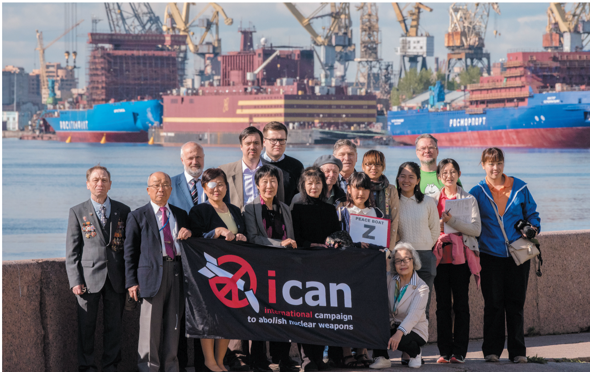
30 мая 2017 года. Хибакуси – жертвы атомной бомбардировки в Хиросиме и Нагасаки – присоединились к акции против запуска атомного реактора в центре Петербурга. На заднем плане – плавучая АЭС «Академик Ломоносов».