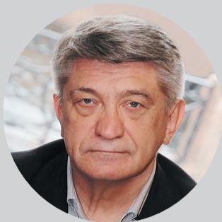
Александр СОКУРОВ, кинорежиссёр, народный артист России:

«Из всех партий или групп, профессионально занимающихся политикой, только «ЯБЛОКО» занимается градозащитной деятельностью в Санкт-Петербурге. Именно благодаря «ЯБЛОКУ» я сам очень многое понял в градозащитной работе. Они ведь